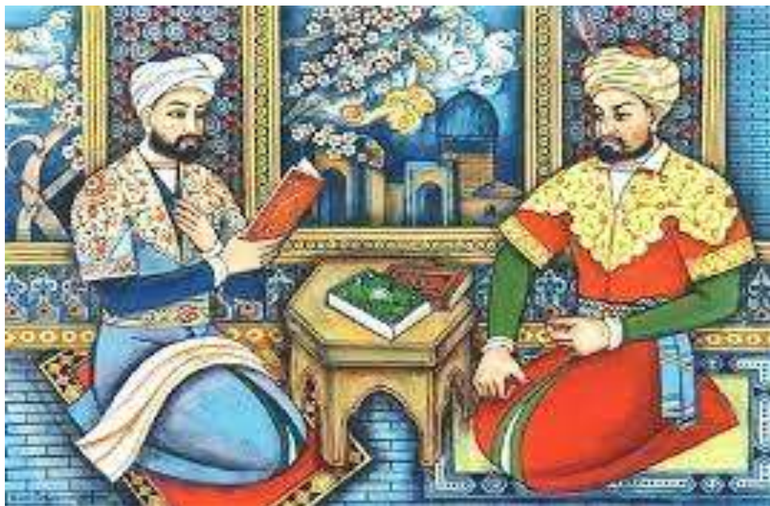
5-расм. Девоний Хусаний. Шарқ китобат санъати.

йўли хикоялари» ва бошқа кўпгина китобларни Китобат санъати усулида нафис безаклар, тасвирлар билан безатиб тайёрлаган.