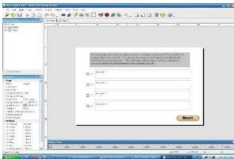
3-rasm. “Quiz” loyihasining tanlanishi.

Mavjud loyihani tanlashning ijobiy tomonlaridan biri shundaki, unda Web-sahifa uchun ba’zi ssenariylar tayyor yozilgan holatda bo’ladi. Ba’zi ob’ektlar uchun bajariladigan funksiyalar esa tayyor holatda berilgan bo’ladi. Bunday imkoniyat qisqa vaqtda murakkab tuzilmali katta loyihani yaratishda amaliy yordam beradi.